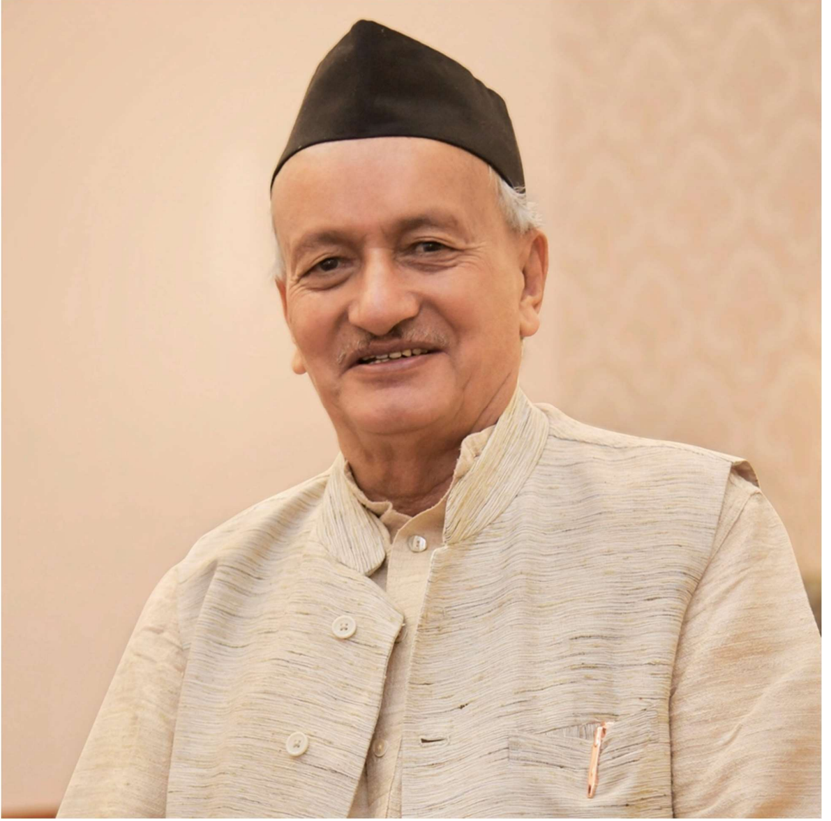
महामहीम श्री. भगतसिंह कोश्यारी कुलपती तथा राज्यपाल, महाराष्ट्र राज्य