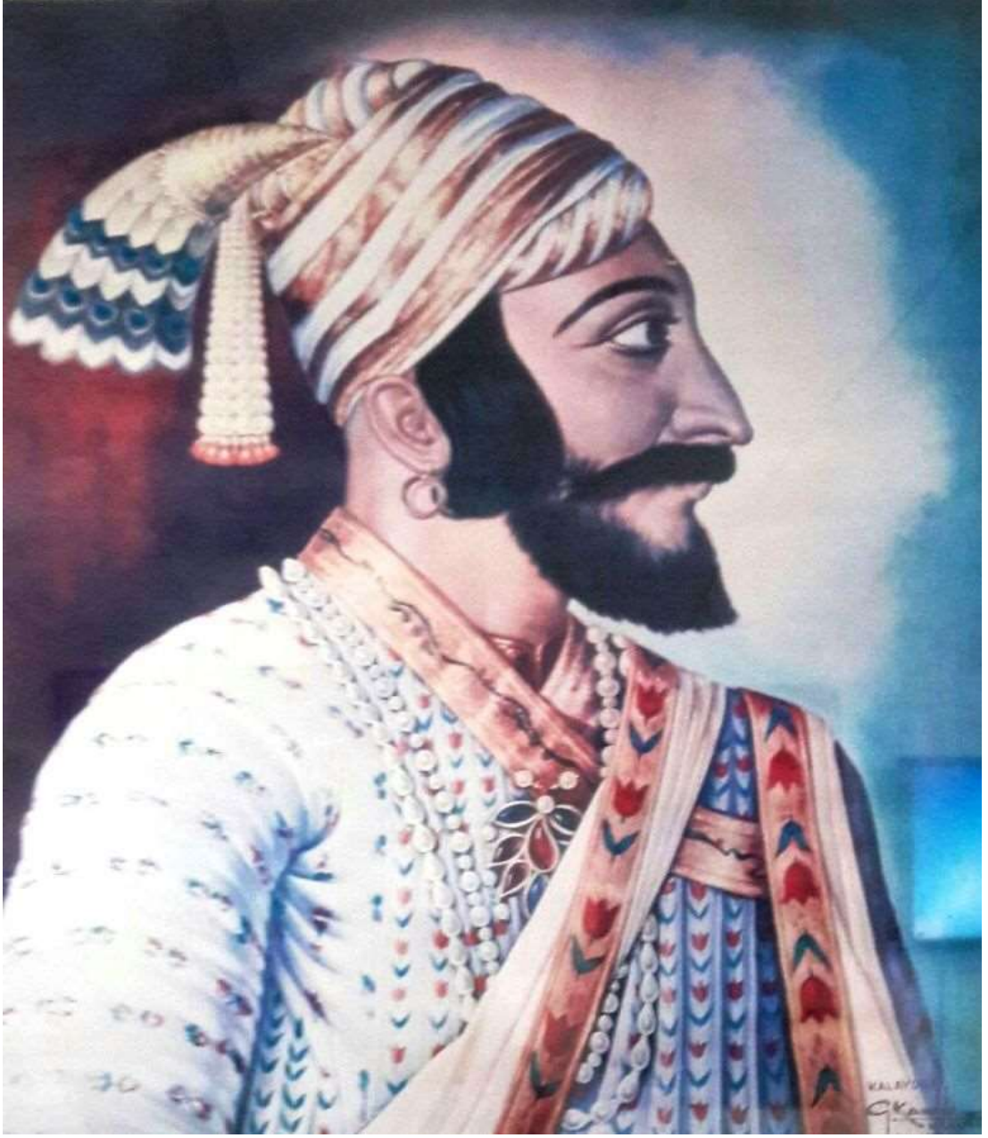
छत्रपती श्री. शिवाजी महाराज