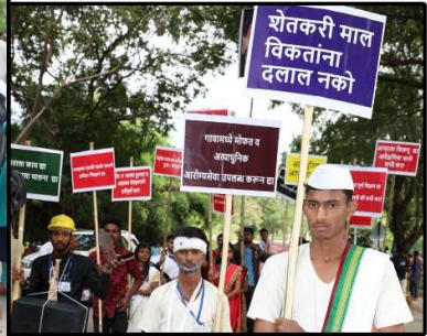
युवा महोत्सव २०२२ शोभायात्रेतील विविध भावमुद्रा.