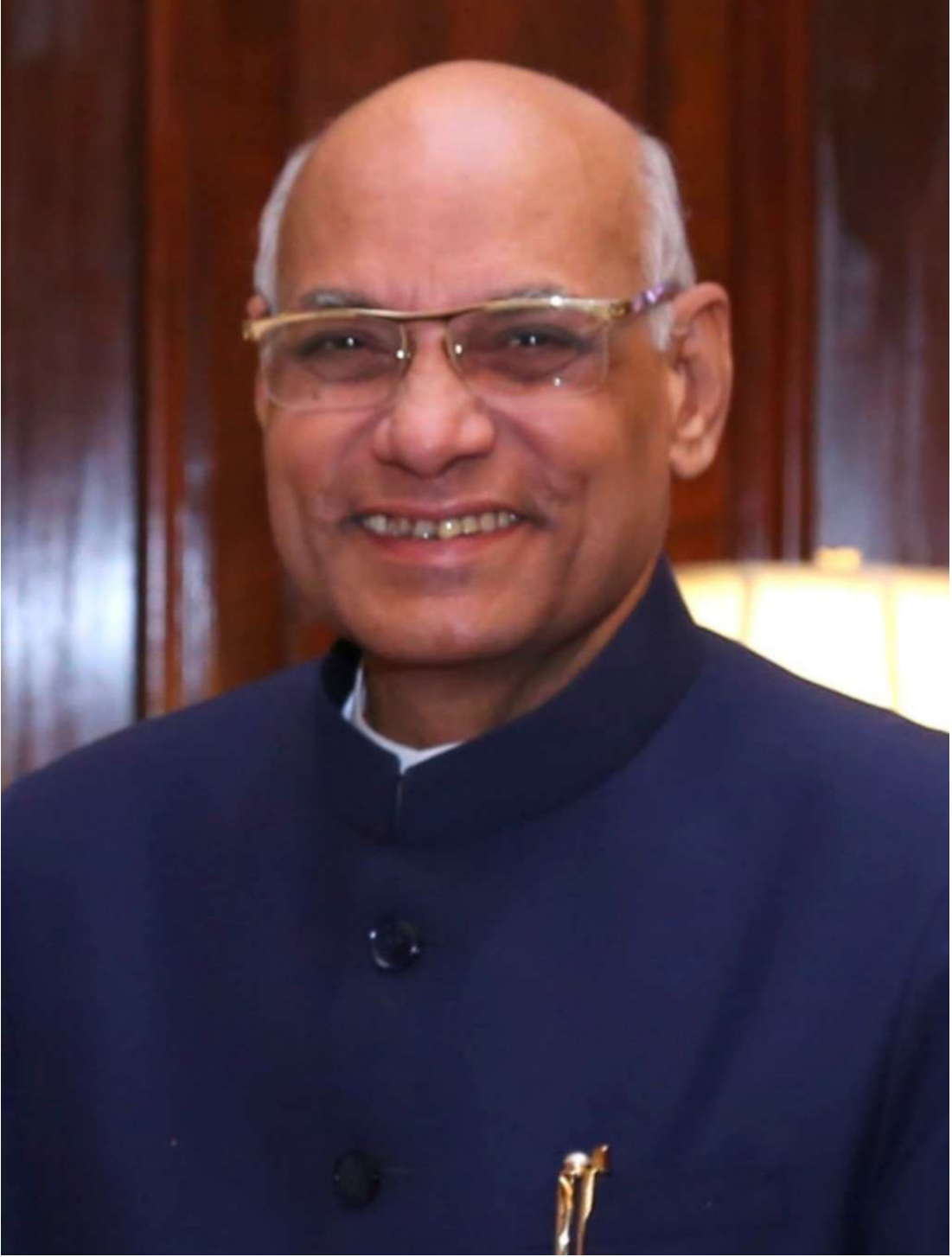
महामहीम मा. श्री. रमेश बैस कुलपती